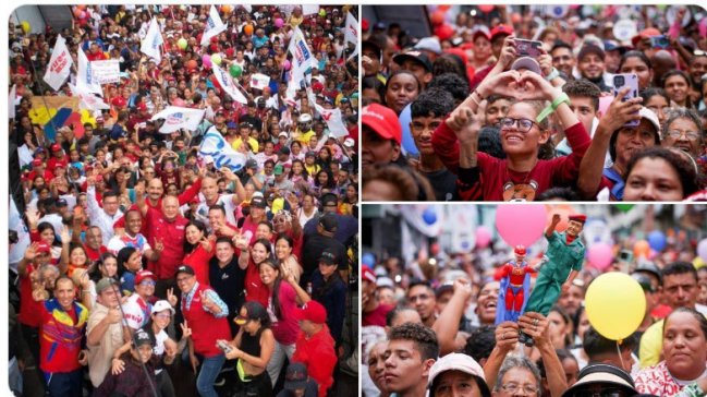
8:24 p. m. · 6 may. 2024 ·

Mi gente de Coche se han movilizado por las calles de esta hermosa Parroquia de Caracas, demostrando su organización y alta movilización del Poder Popular, en rechazo las las sanciones y en respaldo al legado que continuamos construyendo con esfuerzo propio, haciendo mucho con poco, y demostrando que no hay nada ni nadie que detenga a un pueblo aguerrido y valiente. ¡Mi abrazo para todas y todos ustedes!