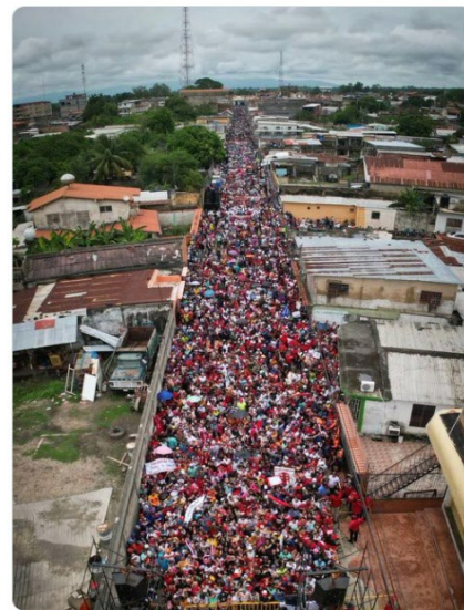
3:04 p. m. · 8 may. 2024

Mis hermanos y hermanas de Sabana de Mendoza, municipio Sucre, en el estado Trujillo, se movilizaron para rechazar contundentemente el bloqueo y las sanciones imperialistas en contra de nuestra Patria. Un fuerte abrazo a las guerreras y los guerreros trujillanos. ¡Vamos pa' lante!