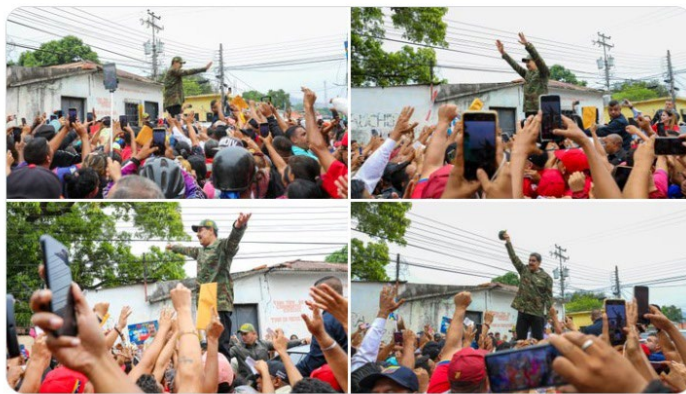
10:54 a. m. · 4 may. 2024 ·

¡Tinaco me impregnó de alegría! El estado Cojedes salió a las calles a demostrar su amor y su apoyo incondicional. Por encima de las dificultades saldremos victoriosos y seguiremos de pie para construir la Patria próspera, unida e independiente.