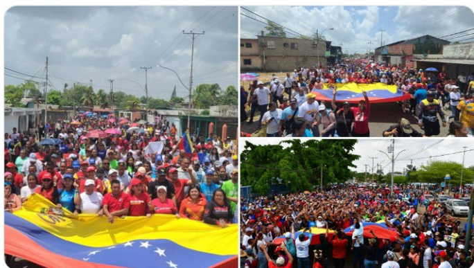
7:20 p. m. · 4 may. 2024 ·

Estos son los hombres y mujeres de a pie, organizados, conscientes y movilizados en Tucupita, del estado Delta Amacuro, quienes defienden nuestra soberanía y la Paz de Venezuela. ¡La esperanza está en la calle!