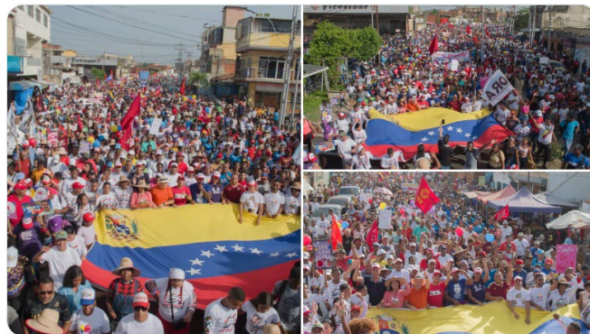
9:32 p. m. · 7 may. 2024 ·

¡Impresionante! El pueblo de Higuerote, municipio Brión del estado Miranda, marchó en unión perfecta, liderazgo y organización. Demostrándole al mundo que los revolucionarios y revolucionarias seguiremos defendiendo la verdad bonita de Venezuela. ¡Somos gente de Paz!