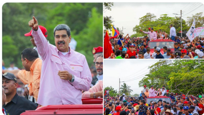
8:56 p. m. · 7 may. 2024 ·

Cuando veo todo lo que hacemos, digo que sí es posible hacer los grandes cambios que Venezuela necesita en los años que están por venir, y solo nosotros podemos conducir ese proceso hacia la grandeza, la prosperidad, el bienestar y la Venezuela nueva, estos son los valores que debemos sembrar en la juventud que se está levantando.