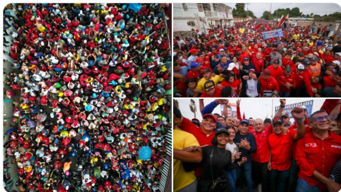
7:31 p. m. · 2 may. 2024 ·

¡Mi gente querida de Maracaibo, Zulia! Esta es la demostración de un pueblo rebelde con alta consciencia revolucionaria y una memoria patriótica que le dice al imperialismo: ¡No al bloqueo! Y decimos: ¡La esperanza está en la calle! ¡Somos libres, soberanos e independientes! ¡Venezuela se respeta!