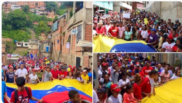
7:42 p. m. · 30 sept. 2023 ·

Miranda una vez más demuestra su compromiso con Venezuela, la comunidad de la parroquia Caucagüita en el municipio Sucre, se volcó a las calles con entusiasmo y dignidad. Qué bonito ver esta movilización de mujeres y hombres aguerridos.