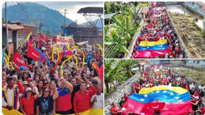
3:45 p. m. · 1 oct. 2023

El pueblo del municipio Santos Marquina en el estado Mérida, se movilizó por la Paz de Venezuela. ¡Qué alegría verlos movillizados, con conciencia histórica y amor patrio! ¡Les abrazo pueblo amado!