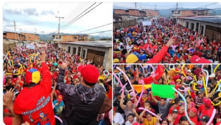
3:16 p. m. · 30 sept. 2023

Mis saludos al maravilloso pueblo de Guayacán de las Flores, en la parroquia Santa Catalina, municipio Bermúdez del estado Sucre, que han demostrado su fuerza y voluntad para seguir adelante por Venezuela. Sigamos luchando en unión y con la moral en alto para alcanzar el máximo bienestar de nuestra Patria. ¡Viva el Pueblo sucrense!