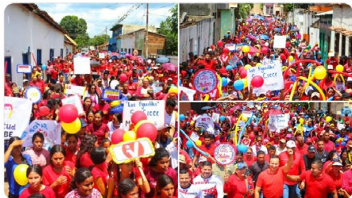
3:28 p. m. · 30 sept. 2023

El municipio San José de Guaribe del estado Guárico, se llenó de pueblo luchador, valiente y comprometido con un futuro de bienestar social, prosperidad y Paz. ¡Cuentan conmigo pueblo amado, para seguir construyendo la Patria buena, independiente y soberana!